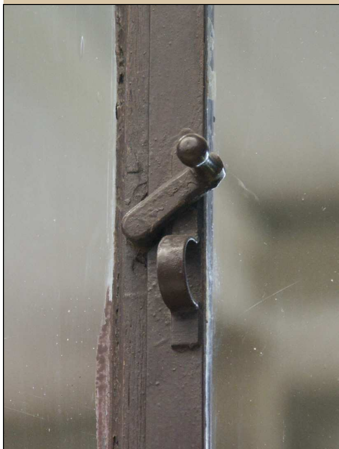
obrtlík na okenním křídle