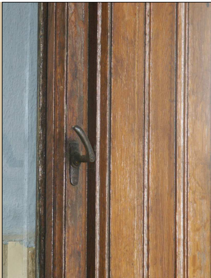
původní secesní klička