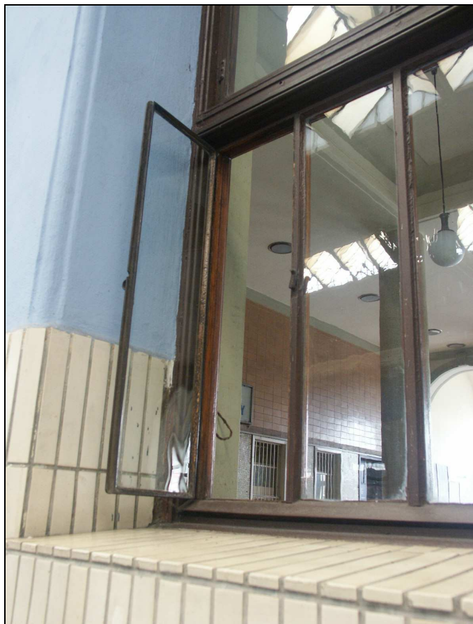
pohled na okenní křídlo z interiéru