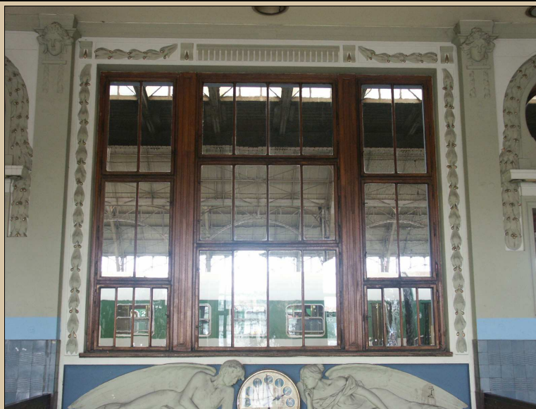
pohled na okno z interiéru příjezdové haly

Doporučujeme okno repasovat a ponechat na původním místě. Obnovit původní fládrování. Viz technologický postup TP/117 (lepené sklo).